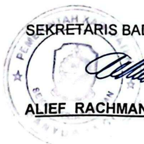
SEKRETARIS BADAN ANGGARAN,